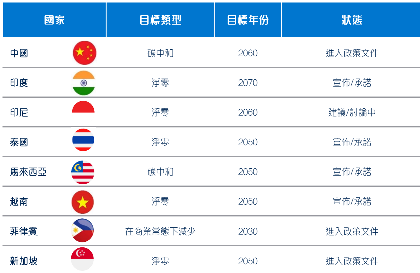
圖3：部分亞洲國家的排放目標