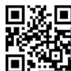
積金易流動應用程式