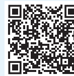
強積金計劃說明書

principal.com.hk/sites/default/files/general-files/S800_C.pdf