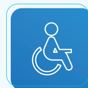
完全喪失 行為能力